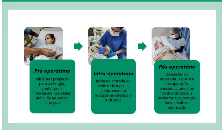
Figura 2 - Etapas do período perioperatório. Florianópolis – SC, Brasil, Florianópolis – SC, Brasil, 2020.