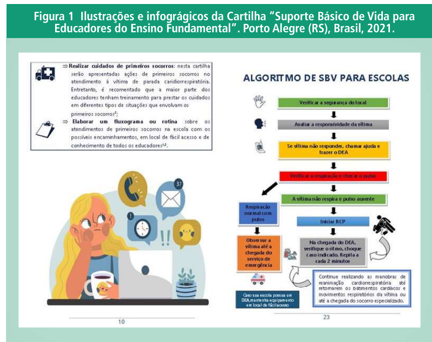
Figura 1 Ilustrações e infográficos da Cartilha “Suporte Básico de Vida para Educadores do Ensino Fundamental”. Porto Alegre (RS), Brasil, 2021.